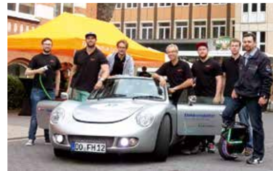
Das Team der FH Dortmund mit dem „deSpyder“.