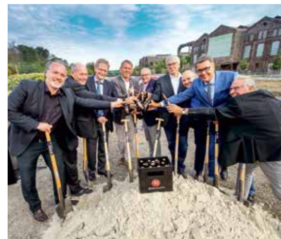
Anstoßen auf den Erfolg der Bergmann Brauerei beim ersten Spatenstich auf PHOENIX West.