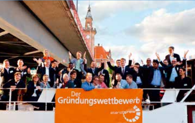
Gewinner an Bord: Die Prämierung der Preisträger des Gründungswettbewerb start2grow fand auf der Santa Monika statt.