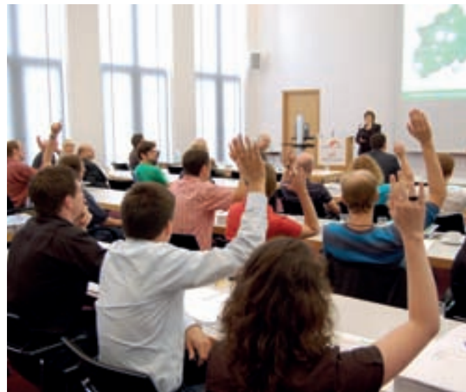
Sowohl die Studierenden als auch die Unternehmen bewerteten die 3. Dortmunder Summer School Mikrotechnik überaus positiv.