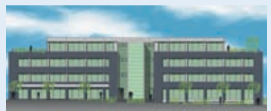
Die Animation zeigt, wie das „Quartier Z“ nach der Fertigstellung aussehen wird.