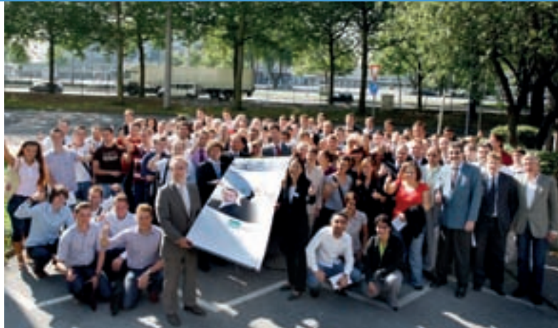
150 junge Menschen haben zum neuen Semester an der FOM Dortmund ihr Studium aufgenommen.