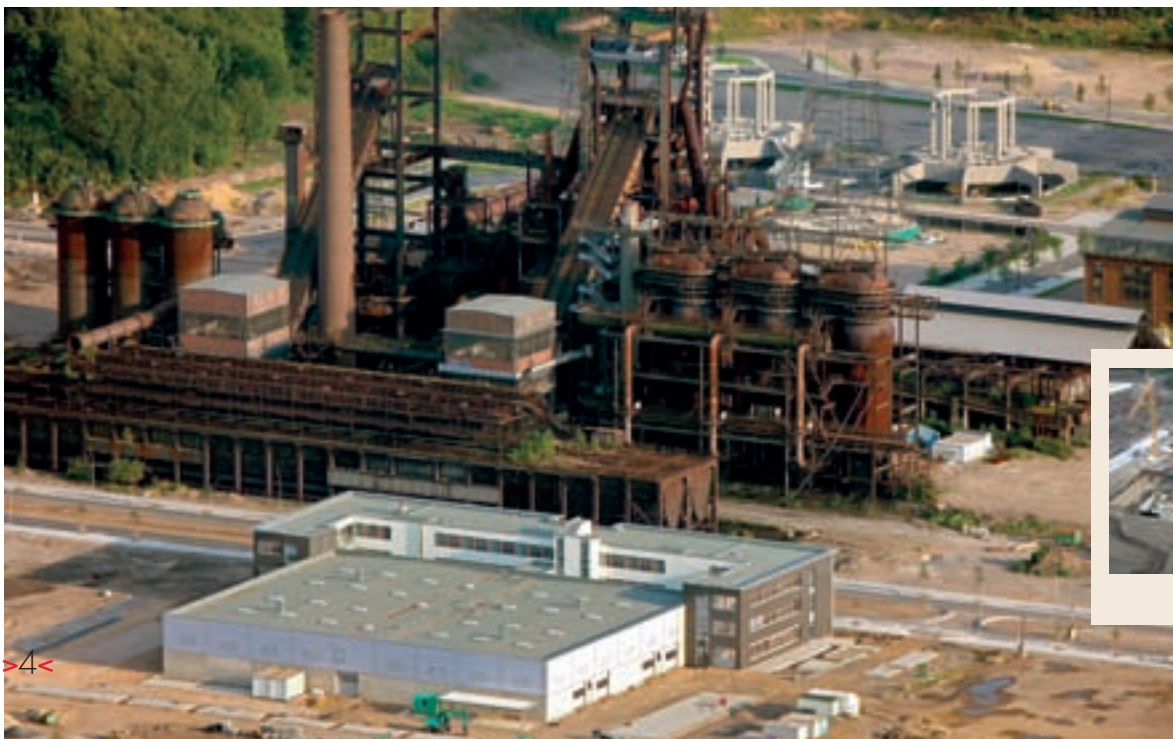
In unmittelbarer Nachbarschaft zum ehemaligen Hochofenwerk ist das ZfP Dortmund entstanden.