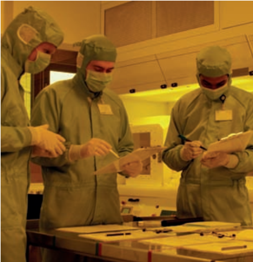
Innolume baut seine Entwicklungskapazitäten aus, um die steigende Nachfrage nach seinen neuartigen Lasern zu befriedigen.

Oft scheitert das Vorhaben, eine Fahrgemeinschaft zu gründen, daran, die passenden Kollegen zu finden. Genau dabei will eine Projektgruppe des Business- und Management Trainee-Programms der frankepartner GmbH helfen. Sie hat ein Konzept für eine kostenlose Internetplattform entwickelt, die MitfahrTec. Darüber sollen Mitarbeiter aus dem TechnologieParkDortmund Fahrgemeinschaften organisieren können. Das Konzept „MitfahrTec“ wird am 15. Oktober 2008 um 14.30 Uhr im TechnologieZentrumDortmund, Raum 2070, vorgestellt. Interessierte möchten sich bitte per E-Mail an projekt-fahrgemeinschaften@intercultural-consulting.de anmelden.