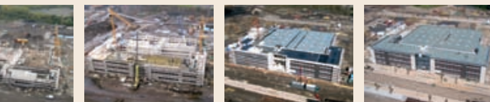
Von August 2007 (Foto li.) bis September 2008 (Foto re.) hat das ZfP Dortmund Gestalt angenommen.