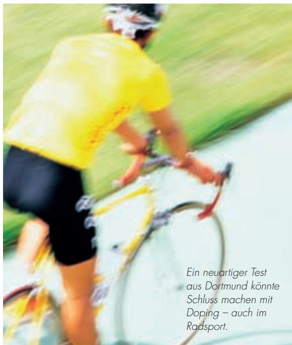
Ein neuartiger Test aus Dortmund könnte Schluss machen mit Doping – auch im Radsport.