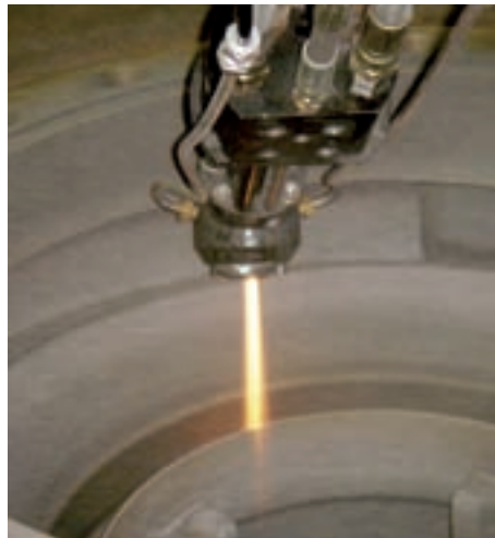
Hochgeschwindigkeitsflammspritz-Anlagen ermöglichen die Innenbeschichtung von schwer zugänglichen Bauteilen.