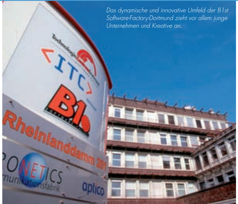
Das dynamische und innovative Umfeld der B1st Software-Factory-Dortmund zieht vor allem junge Unternehmen und Kreative an.