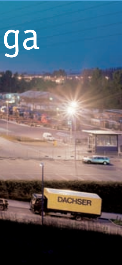
In Dortmund betreibt der internationale Dienstleister Dachser ein Logistikzentrum mit 54.000 Quadratmetern Betriebsfläche.

„Logistics meets IT“ lautet der Untertitel der 25. Dortmunder Gespräche am 11. und 12. September 2007 im Kongresszentrum der Westfalenhallen. Veranstalter sind die Bundesvereinigung Logistik und das Fraunhofer-Institut für Materialfluss und Logistik. Beiträge aus den Bereichen Verkehrslogistik, Software und Systeme, Warehouse Management, RFID und „Internet der Dinge“ schaffen einen Überblick über Strategien, Forschungslinien und zukunftsweisende Praxisbeispiele aus Unternehmen. www.iml.fraunhofer.de