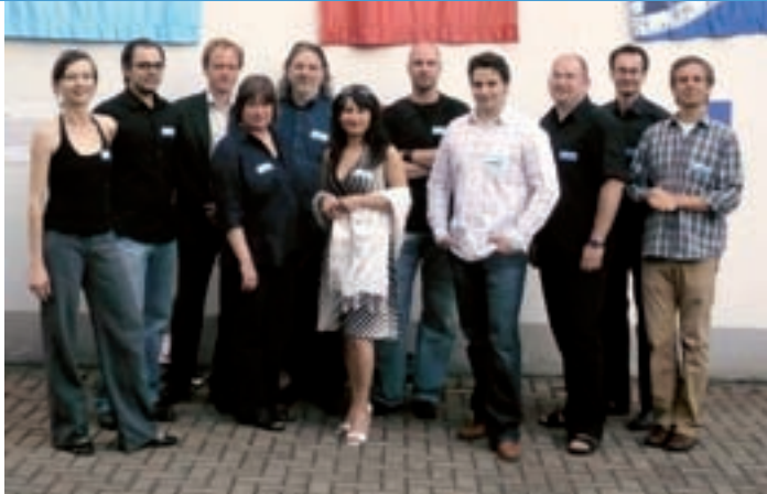
Die Mitglieder des Vereins „51°Nord“ bilden ein Netzwerk von Unternehmen aus der Kreativwirtschaft in der Dortmunder Nordstadt.